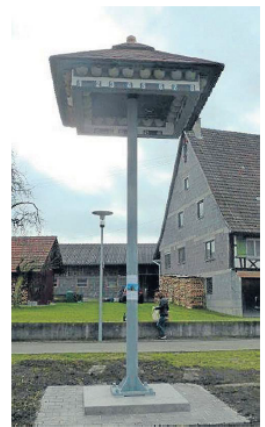
Das neue Schwalbenhotel wird im Frühjahr eingeweiht.

So viel Bürgersinn gefällt den Dorfchef, der sich bei allen Beteiligten bedankt hat und ein Zitat von Hermann Schmitt-Vockenhäuser bemüht: „Die Gemeinden sind der eigentliche Ort der Wahrheit, weil sie der Ort der Wirklichkeit sind!“